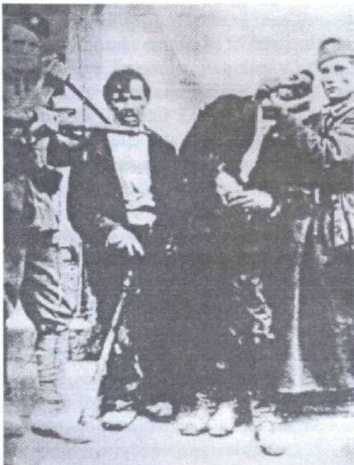
Усшае муче своје жртве у Јасеновачком логору

оруђима за мучење и уништавање логораша уништавали су их без милости.